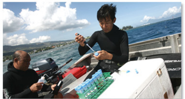
Surveillance de la ciguatera

L'éventail des recherches est large : maladies transmissibles (dengue, filariose), micro-algues toxiques (ciguatera), lutte contre les insectes vecteurs ou nuisants, identification des propriétés biologiques de plantes locales et valorisation de la médecine traditionnelle. Son expertise est reconnue au niveau régional et international et se concrétise par de nombreux accords de collaboration.