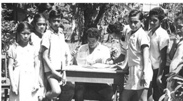
Distribution de Notézine par les taote mariri

Dans les années 50, la stratégie de lutte contre la filariose s'organise: lutte contre les moustiques, dépistage des porteurs de microfilaries et distribution de Notézine par les taote mariri . La maladie recule enfin.