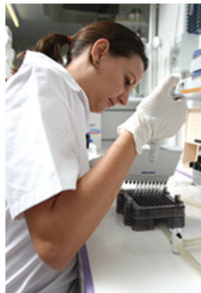
Recherches en virologie